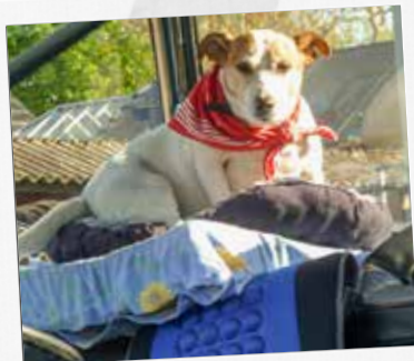
HOND MILO REIST OVERAL MEE NAARTOE.

route uitgestippeld, dat wel. Maar waar we zouden slapen, beslisten we onderweg. Hoe ver we reden, ook. Als gepensioneerd hebben we tenslotte tijd genoeg: over de hele reis deden we uiteindelijk acht weken. We legden gemiddeld ongeveer 100 kilometer per dag af. Waren we moe? Dan zochten we op goed geluk een kampeerplek." Zich door het toeval laten leiden, blijkt te lonen. Omdat ze met hun tractor de autosnelweg niet op mogen, nemen ze de fietsroute. Zo ontdekt het duo de leuke plekjes. "In La Chapelle-d'Angillon leidde een handgeschreven bord ons bijvoorbeeld naar een camping aan een rivier, met prachtig uitzicht op het kasteel van La Chapelle. Maar even goed gebeurde het dat we geen échte camping vonden. Zo logeerden we gratis op een parking achter een muziekschool in Monforte de Lemos na een tip van een vrouw die haar honden aan het uitlaten was. Ze nam spontaan een blad papier en tekende voor ons de weg. We stonden er op een gezellige plek aan een riviertje. De muziek op de achtergrond kregen we er gratis bij. Die vrouw is de avond zelf trouwens nog komen kijken of we het gevonden hadden. Een fijne ervaring was dat."